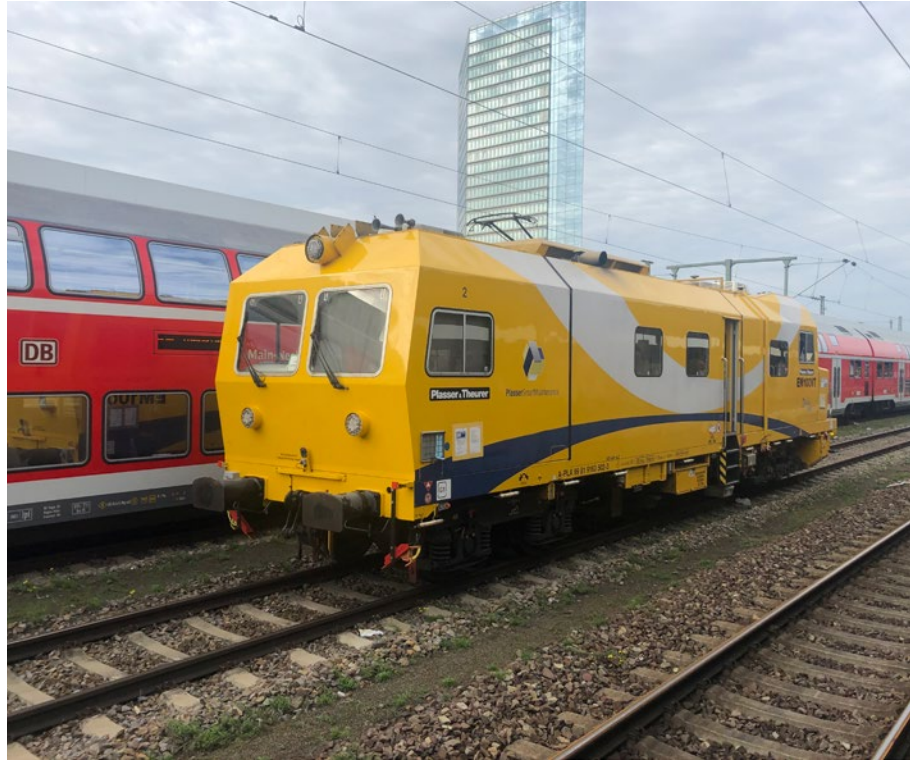
1: EM100VT im Produktiveinsatz in Deutschland

Digitale Streckenplanung beschreibt die durchgängige digitale Bearbeitung von Bestandserneuerungsprojekten in einem konsistenten Datenmodell.