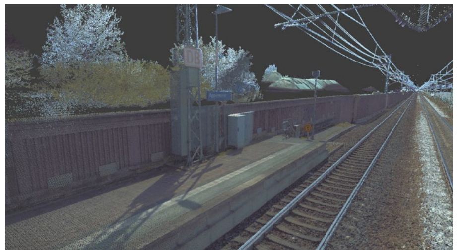
3: Kolorierte Punktwolke aus dem Projekt Offenburger Tunnel

Anschließend wurde bei einem Erneuerungsprojekt auf der Schwarzwaldbahn zwischen Hornberg und St. Georgen eine Befahrung mit einem vergleichbaren System durchgeführt. Neben der bewährten Kombination aus Laserscanning, Fotodokumentation und Georadar erfolgte hier erstmalig testweise eine kinematische Vermessung bei Befahrung mit 30 km/h. Dazu wurde die Strecke mit Fixpunkttafeln (30x30 cm) ausgestattet, die tachymetrisch eingemessen und anschließend durch einen Algorithmus in den Laserscandaten detektiert wurden.